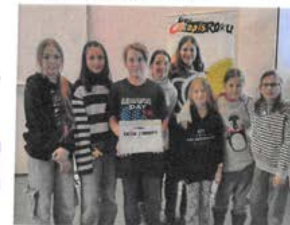
Redakční tým při převzetí Ceny poroty