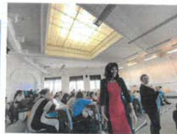
Před předáním ceny v posluchárně univerzity