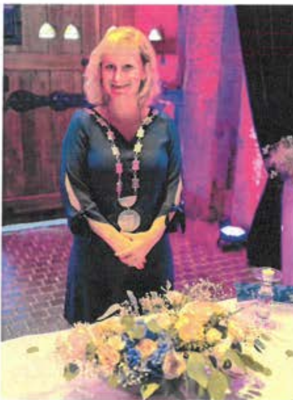
K povinnostem místostarostky patří i oddávání, zde v Písecké bráně

Moc se těším na naše rodinné slavení, které máme opravdu tradiční, ale i na vánoční besídky na školách, cukroví, vánoční setkávání a rozdávání dáreků. To mám teď už radši, než dárky dostávat.