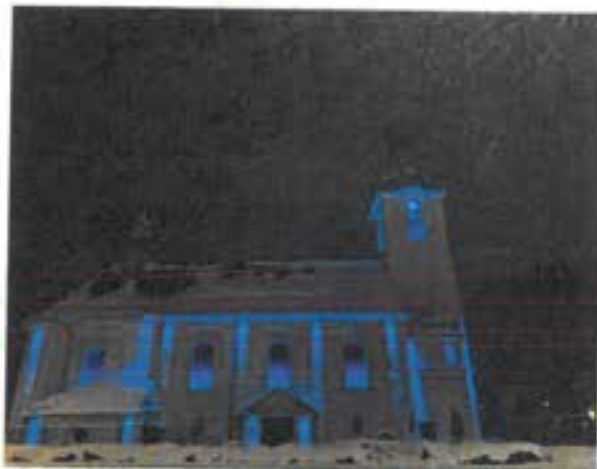
Nádherné osvětlený vesnický kostel