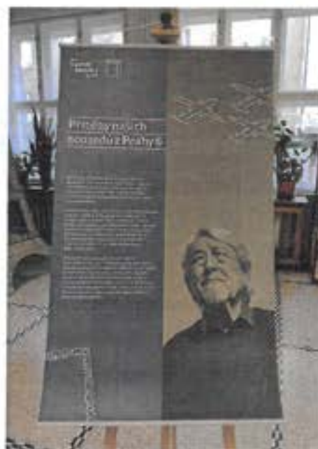
Výstava ve vestibulu a na chodbách školy

Autoři výstavy vybrali čtrnáct silných příběhů objevených žáky základních škol z Prahy 6 zejména v posledních třech letech. Sedm příběhů vypráví o období druhé světové války, dalších sedm pak o komunistickém režimu druhé poloviny 20. století v Československu.