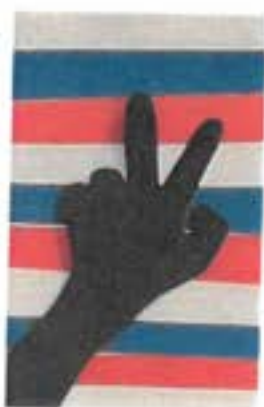
Práce dětí z ŠD