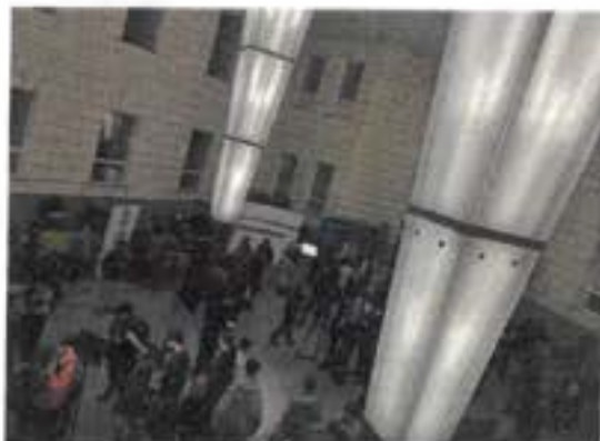
Mediální trh v atriu Masarykovy univerzity

Celý den byl pro nás nejen obohacující, ale i zábavný.