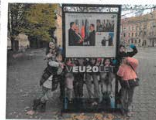
Poslední společná fotka