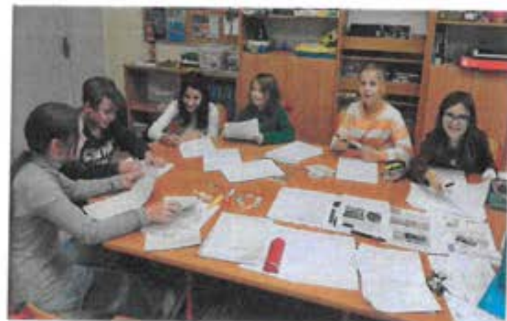
Redakční tým při vyhodnocování ankety tříd