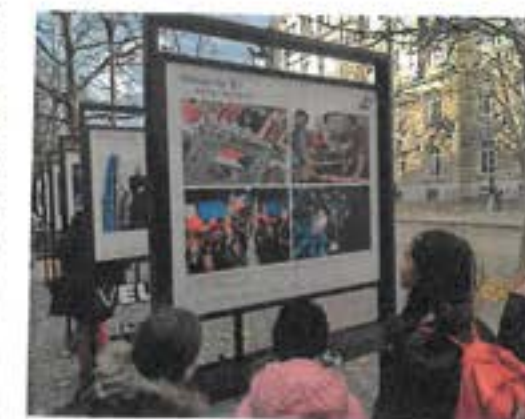
Výstava, v pozadí Masarykova univerzita