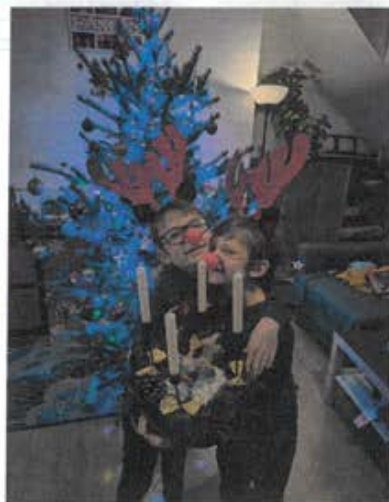
ŠTASTNÉ a VESELÉ Vánoce!

Obtížný úkol, obraz tebe v zrcadle, zakopané pastelky.