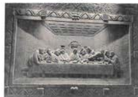
Sochařské ztvárnění „Poslední večeře“