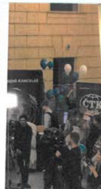
Mediální jarmark