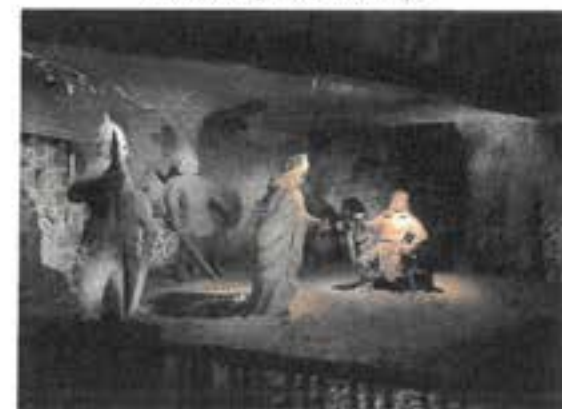
Solné doly Vělička

Když jsme byli v Krakově, všechno bylo krásné a zajímavé, i v solných dolech ve Věličce. V Osvětimi bylo smutno.