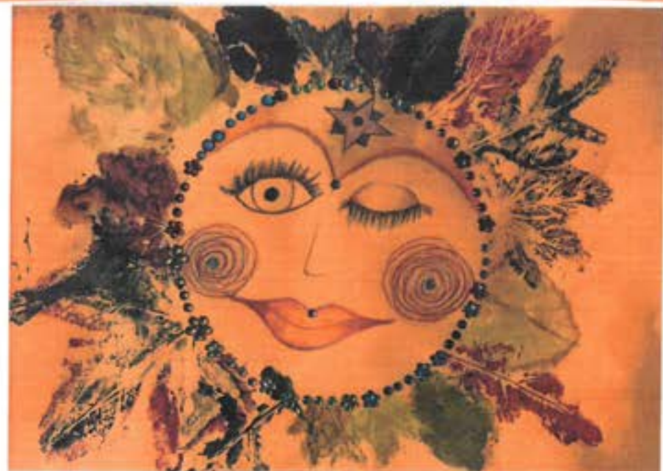
Podzimní slunce je malování na papír A3 pastelkami a místo paprsku jsou obtisknuté listy stromu, které jsme nasbírali ve Stromovce. Nikolka Šedinová, 3C