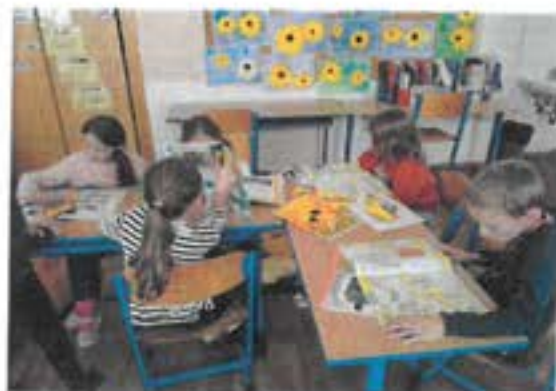
Děti ze 3. C při čtení a prohlížení časopisů