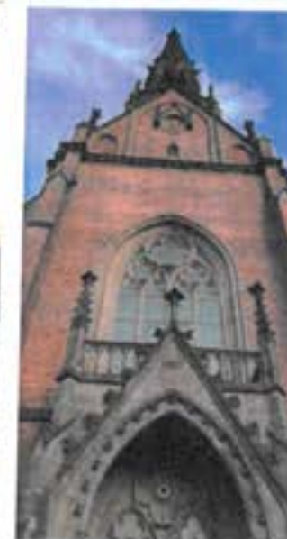
Katedrála J. A. Komenského