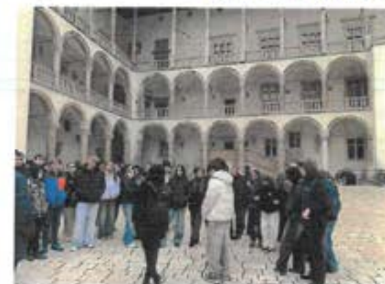
Královský hrad Wawel