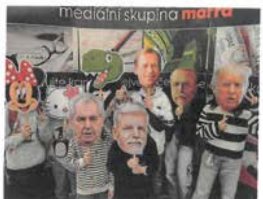
Mediální skupina; Poznáš, kdo to je?

Sešli zme sa v metru na Dejvické už v 5:15 hodin. Bylo nás devět. Po pohodové a zábavné cestě moderním vlakem ve dvou kupéčkách zme po osmé hodině konečně dorazili do Brna. Z hlavního nádraží zme sa ešte museli dostat k místu konání na Joštově ulici šalinó. Plánovali zme jet čtyřko, ale ta jela jen jedním směrem, zrovna opačným než zme chtěli – kvůli jakési výluce. Tož zme chvíli hledali v jízdním řádu, kteréže jinó šalinó byzme teda jeli. Nakonec nás napadlo zeptat se řidičky zrovna příjíždějící šaliny. A udělal zme dobře, poradila nám devítku. Devítko to byly jen čtyři zastávky na Českó, kde zme měli vystúpiť. Šaliny tu majó čistší a betélnější než v Praze, na tom zme sa zhodli. A lidi só tu příjemní a ochotní. Není pravda, že Brňáci Pražáky nemajó rádi, to sú jen předsudky! Všichni na nás byli moc milí, přestože od nás vyzvěděli, že zme z Prahy. Když zme vystúpili z šaliny, první, co zme viděli, bylo k našemu překvapení ruské kolo! Tož si ho hned všeci fotili.