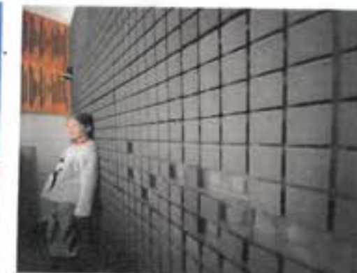
Ve studiu Rádia R