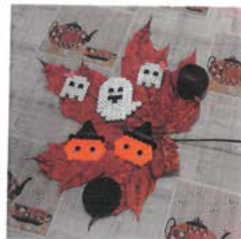
O podzimních prázdninách jsem vytvořila Halloweenskou vzpomínku.

Duchové a roztomilé dýně jsou ze zažehlovacích korálek. Tvořila jsem sama z podzimních javorových listů a kaštanů jsem našla při procházce lesem.