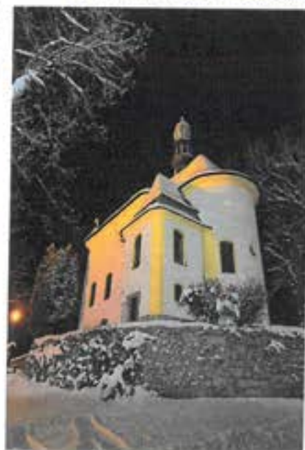
Kostel ve vesnici