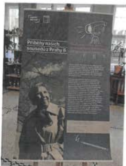
Výstava ve vestibulu školy