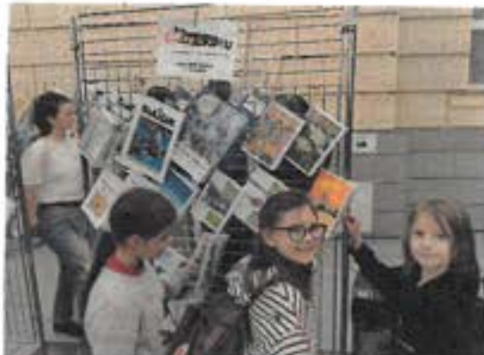
Výstava školních časopisů