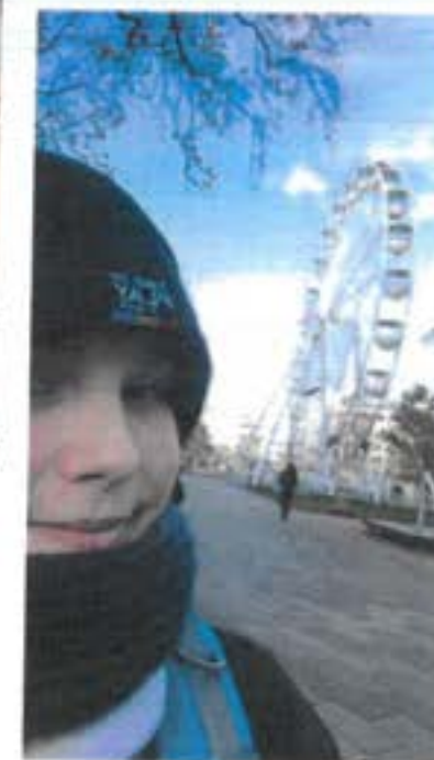
Já a ruské kolo

Na workshopu „Fake news“ – přednášce, spojené s praktickými úkoly, jsme se mohli zamyslet nejen nad tím, jak rozpoznat pravdivost zprávy, ale i třeba nad „poločasem rozpadu faktu“. To znamená, že nějaký fakt se v čase může změnit.