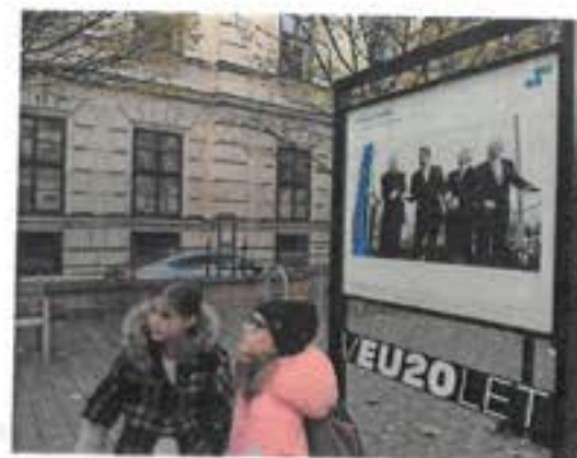
Venkovní výstava „20 let ČR v EU“